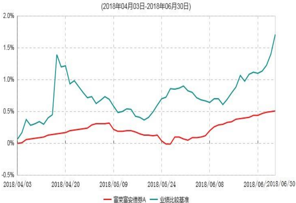
富荣富安债券A累计净值增长率与业绩比较基准收益率历史走势对比图

注：①本基金基金合同于2018年4月03日生效，截止2018年6月30日止，本基金成立未满一年；