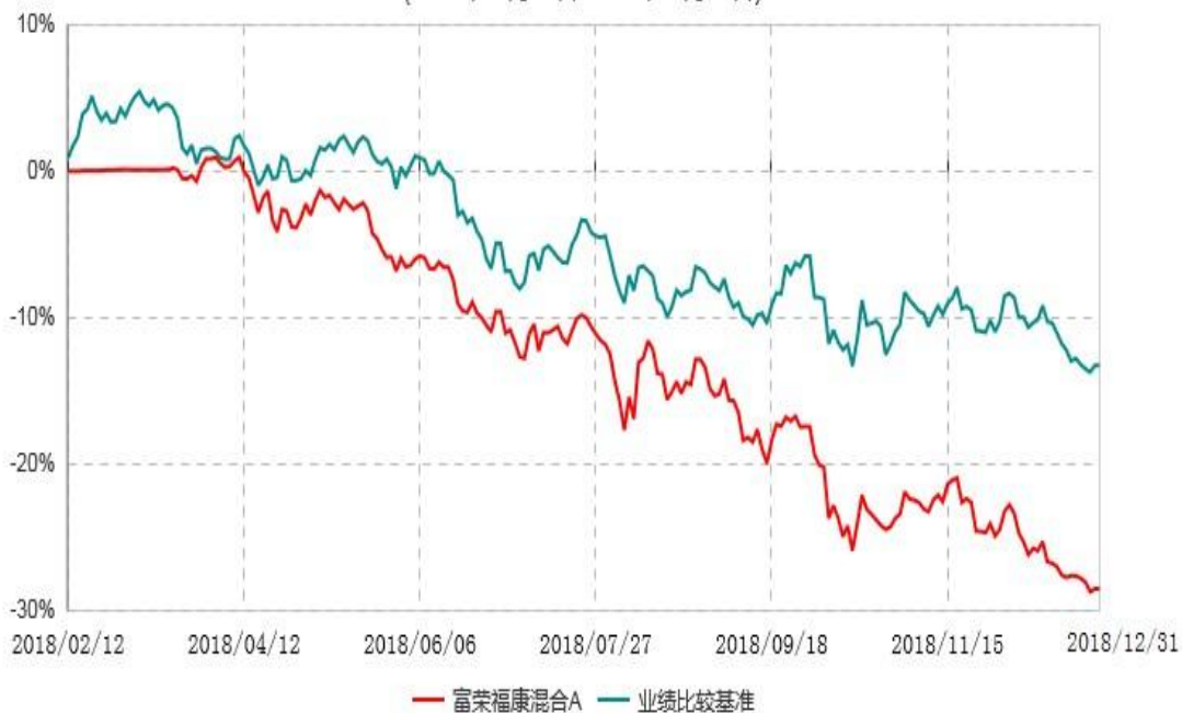
富荣福康混合C累计净值增长率与业绩比较基准收益率历史走势对比图