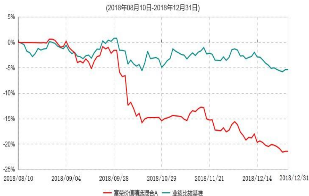
富荣价值精选混合A累计净值增长率与业绩比较基准收益率历史走势对比图