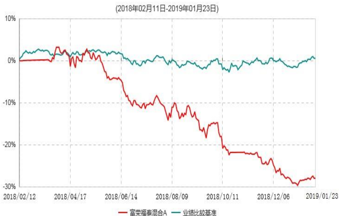
富荣福泰混合A累计净值增长率与业绩比较基准收益率历史走势对比图