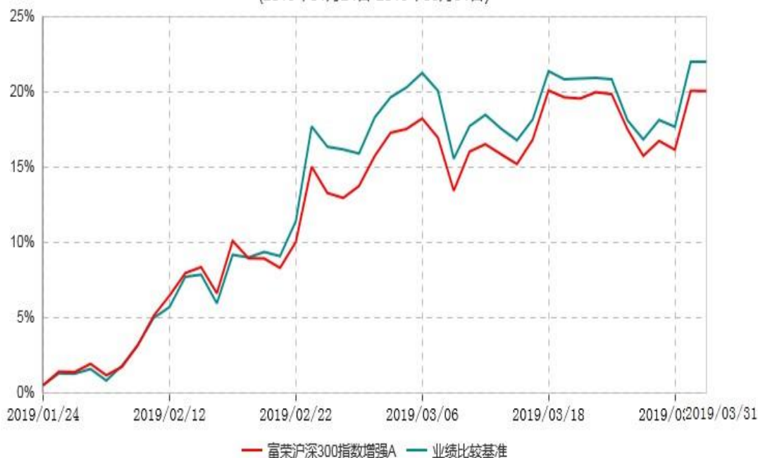
富荣沪深300指数增强C累计净值增长率与业绩比较基准收益率历史走势对比图