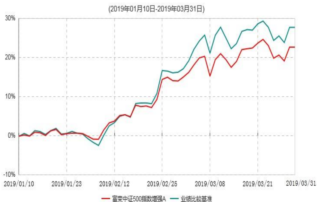
富荣中证500指数增强A累计净值增长率与业绩比较基准收益率历史走势对比图