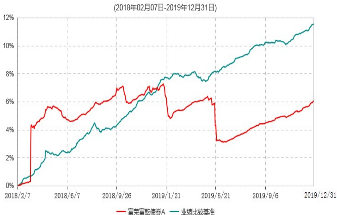
富荣富乾债券C累计净值增长率与业绩比较基准收益率历史走势对比图