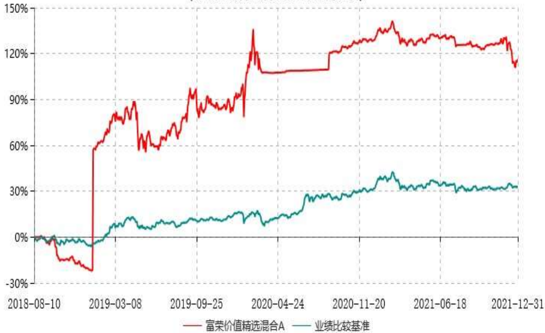
富荣价值精选混合C累计净值增长率与业绩比较基准收益率历史走势对比图