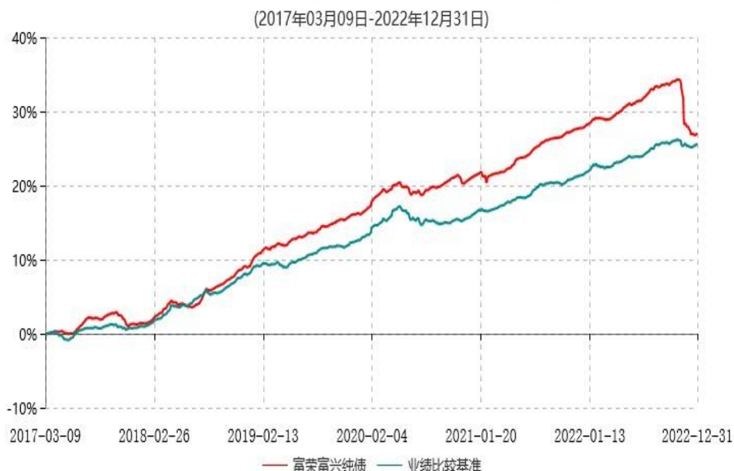
富荣富兴纯债债券型证券投资基金累计净值增长率与业绩比较基准收益率历史走势对比图