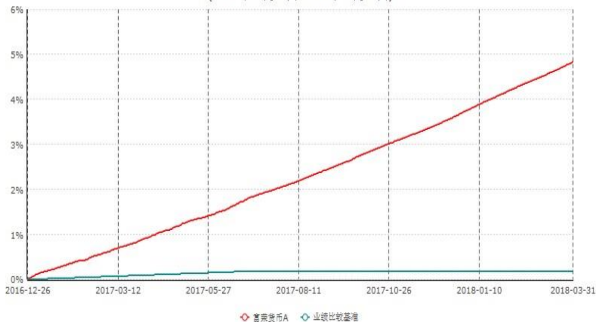
富荣货币A累计净值收益率与业绩比较基准收益率历史走势对比图 (2016年12月26日-2018年03月31日)